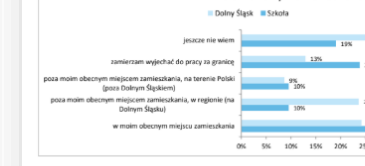
Wykres 6. Porównanie odpowiedzi na pytanie „Moją pracę zawodową chcę wykonywać...” dla Szkoły oraz Dolnego Śląska.